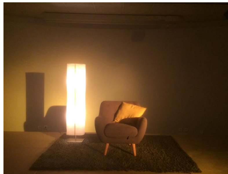
Un petit coin de salon pour la lecture de "Madame Magarotto" à la médiathèque Castagnéra de Talence en janvier 18